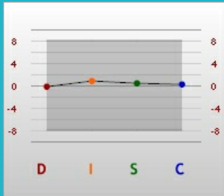
การรับรู้ต่อสาธารณะ