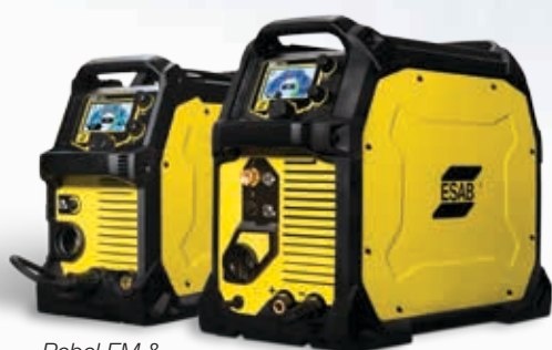
Rebel EM & EMP 215ic