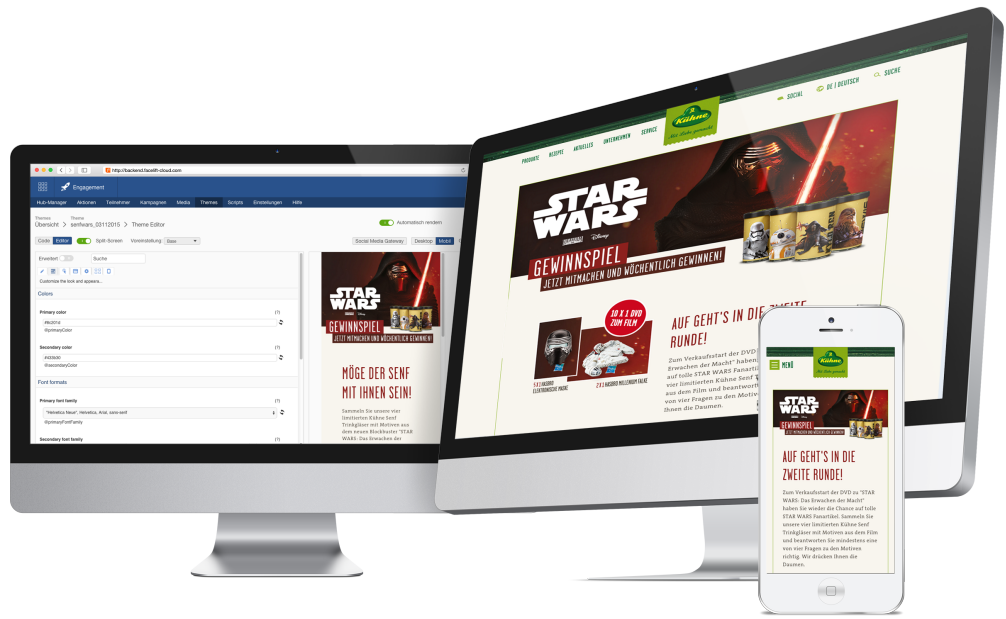
Anpassungen einfach vornehmen mit der Facelift Style Engine