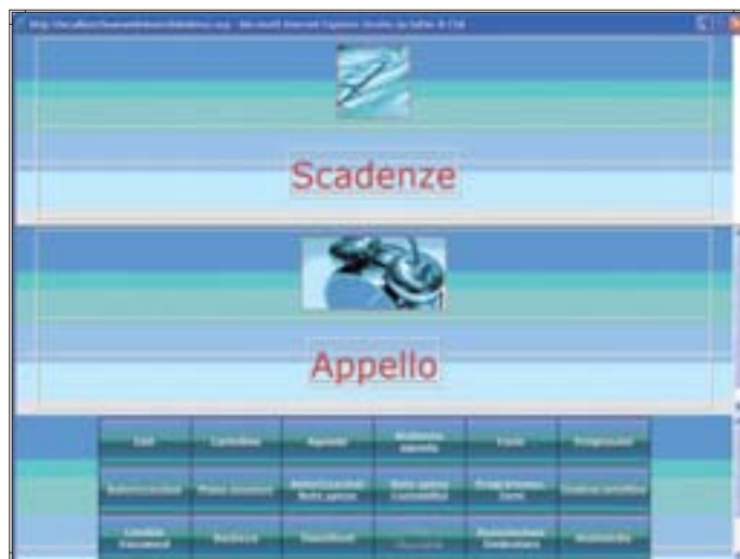
Team WEB: Main Menu