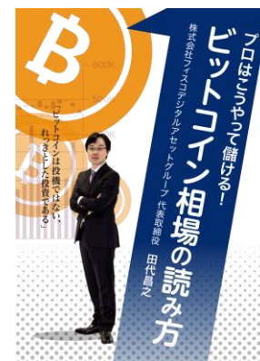
<教材：ビットコイン相場の読み方>

URL： https://offers.istudy.co.jp/bitcoin-course-01