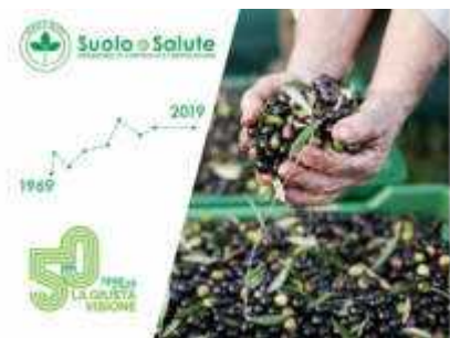
Suolo e Salute, cinquant'anni in piena forma