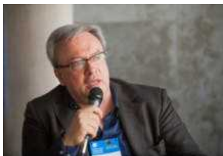
Biologico, Federbio chiede moratoria sulle rotazioni