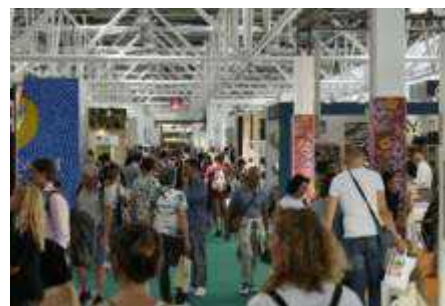
Biologico, ecco le prime anticipazioni sul Sana 2019