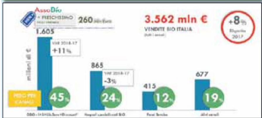
*Dati Nielsen - Mese terminante Nov 2018