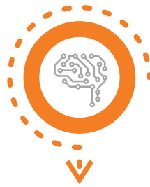
AI Machine Learning, Chatbot and NLP