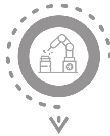
ETL Extract, Transform, Load