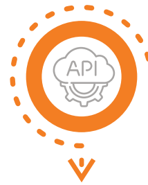
API Rapid API Integration