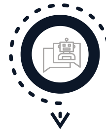
R-Bots Ready Bots for IT, HR & Business