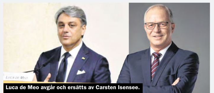
Luca de Meo avgår och ersätts av Carsten Isensee.

Hans avgång kommer samtidigt som det spekuleras om att de Meo har erbjudits att ta över som vd på Renault. Renault har sagt att det utarbetar en lista med kandidater för att ersätta Thierry