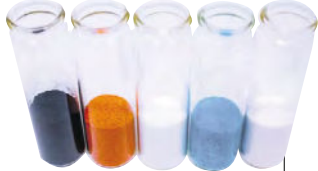
Så kallad black mass samt återvunnen koboltsulfat, litiumhydroxid, nickelsulfat och mangansulfat.

Där är målsättningen att 50 procent av insatsmaterialen till nya battericeller ska komma från återvunna dito till 2030. Det första blocket i den anläggningen väntas kunna tas i drift 2022 med en kapacitet att återvinna cirka 25 000 ton battericeller per år. Processen som företaget ska använda är hydrometallurgisk och är utvecklad tillsammans med Chalmers Tekniska Universitet, den möjliggör återvinning av litium, nickel, mangan och kobolt. ○