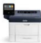
Xerox® VersaLink® B400 printer