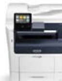
Xerox® VersaLink® B405 multifunctionele printer