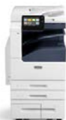
Xerox® VersaLink® C7020/C7025/C7030 multifunctionele kleurenprinter