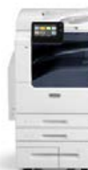
Xerox® VersaLink® B7025/B7030/B7035 multifunctionele printer