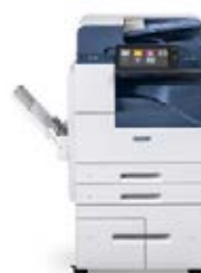
Xerox® AltaLink® B8045/8055/8065/ 8075/8090 multifunctionele printer