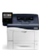
Xerox® VersaLink® C400 kleurenprinter