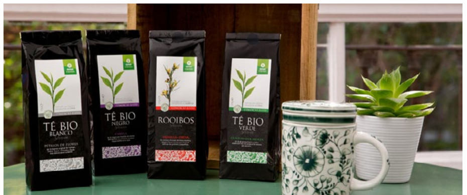
(Té Bio a granel)

No dudes de lo importante que es tu elección, y súmate a todas esas personas que ya compran de manera responsable.