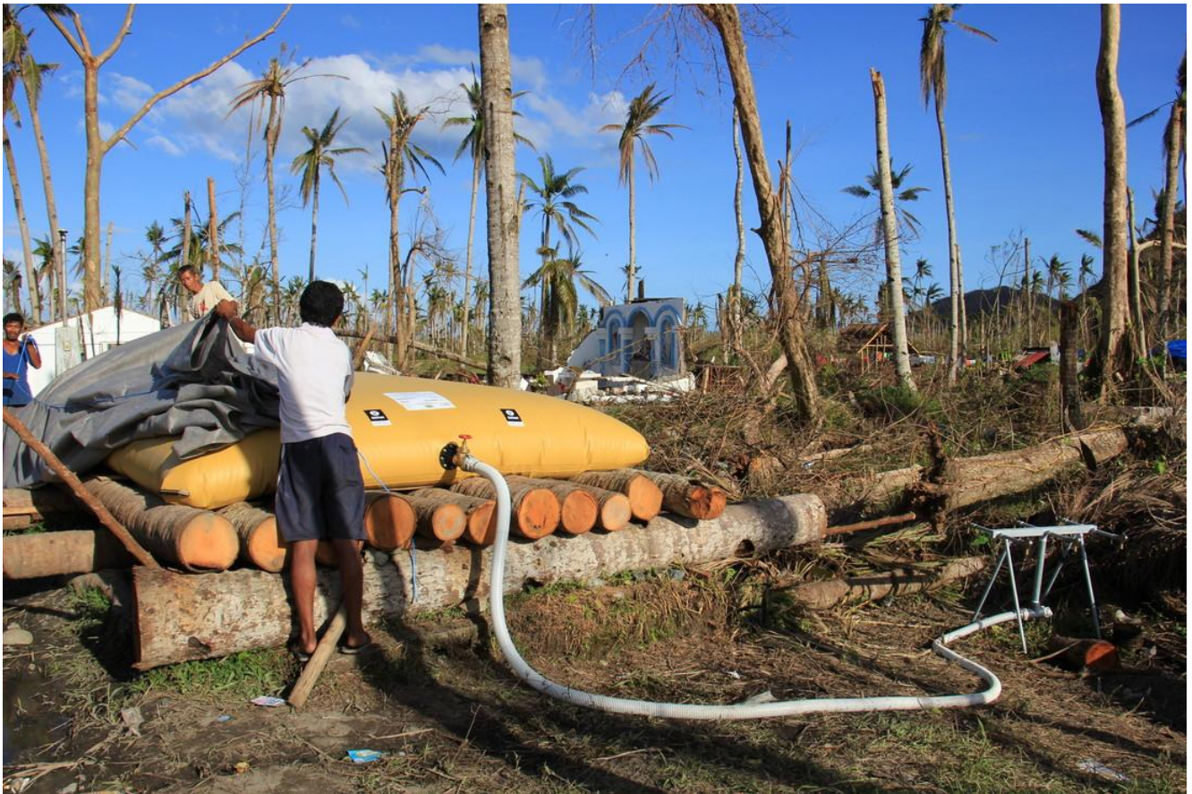
Instalación de un depósito con 10.000 litros de agua potable en Maribi, Leyte (diciembre de 2013).