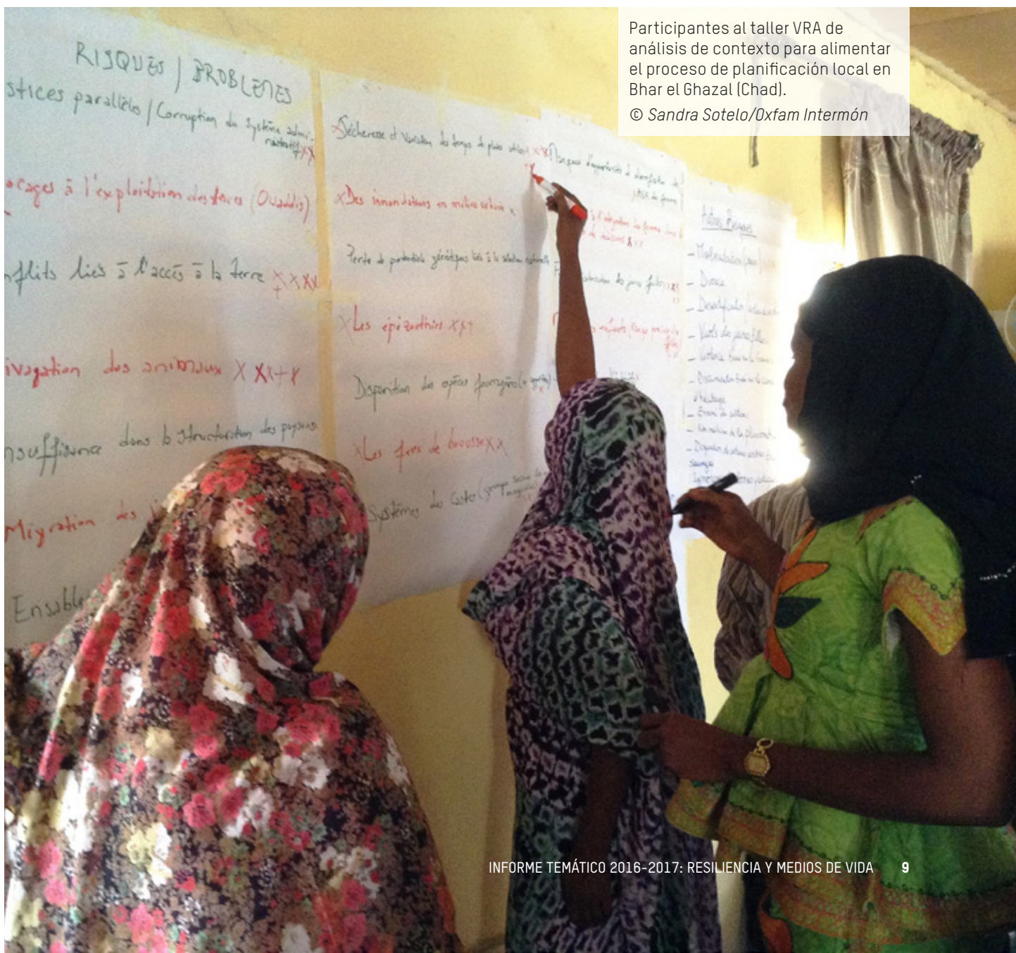
Participantes al taller VRA de análisis de contexto para alimentar el proceso de planificación local en Bhar el Ghazal (Chad).

El Resilience Knowledge Hub sigue trabajando por un cambio de cultura hacia más aprendizaje y más circulación de la información y de las lecciones aprendidas. Esto cobra importancia en un contexto donde no hay inversión común de la Confederación en los Knowledge Hubs, y donde 2 de los 5 knowledge hubs están confrontando grandes dificultades.