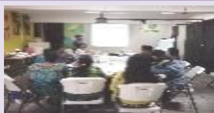
Reunión socialización de proceso de Evaluación, selección de área geográfica, agosto 2017.

El Programa “ Las mujeres y las niñas vivimos libres de violencia ”, fue implementado en el marco del Eje de Justicia de Género de OXFAM en Guatemala, se constituye en una apuesta política de OXFAM en Guatemala, las organizaciones que conforman en Consorcio y la Embajada de Noruega, en el abordaje de la violencia hacia las mujeres indígenas en Guatemala.