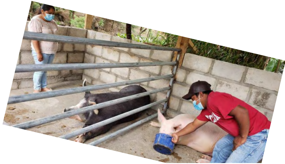
Ilustración 6: Emprendimiento fondo rotatorio, crianza de cerdos y pollos de engorde. Bo. San Francisco, Márcala (UTC- la Paz)