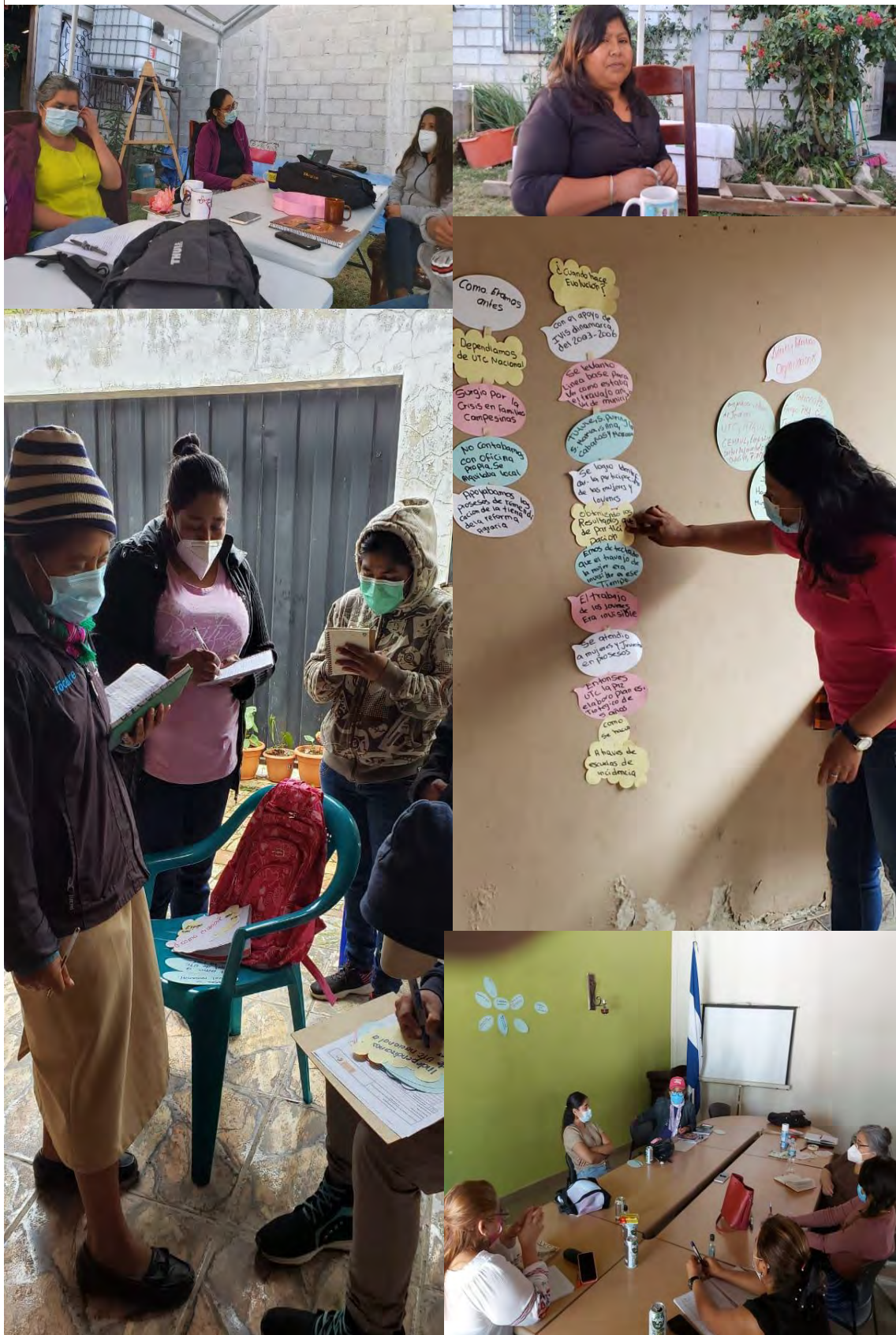
Ilustración 1: Grupos focales con miembros de las redes de mujeres y equipos técnicos, en Intibucá con AMIR. La Paz (UTC-Márcala y CEM-H).

observación y entrevistas a cinco mujeres de la red (dos mujeres de la red, la presidenta de la Red de Mujeres de Otoro y a una participante de la escuela, miembro de la red.)