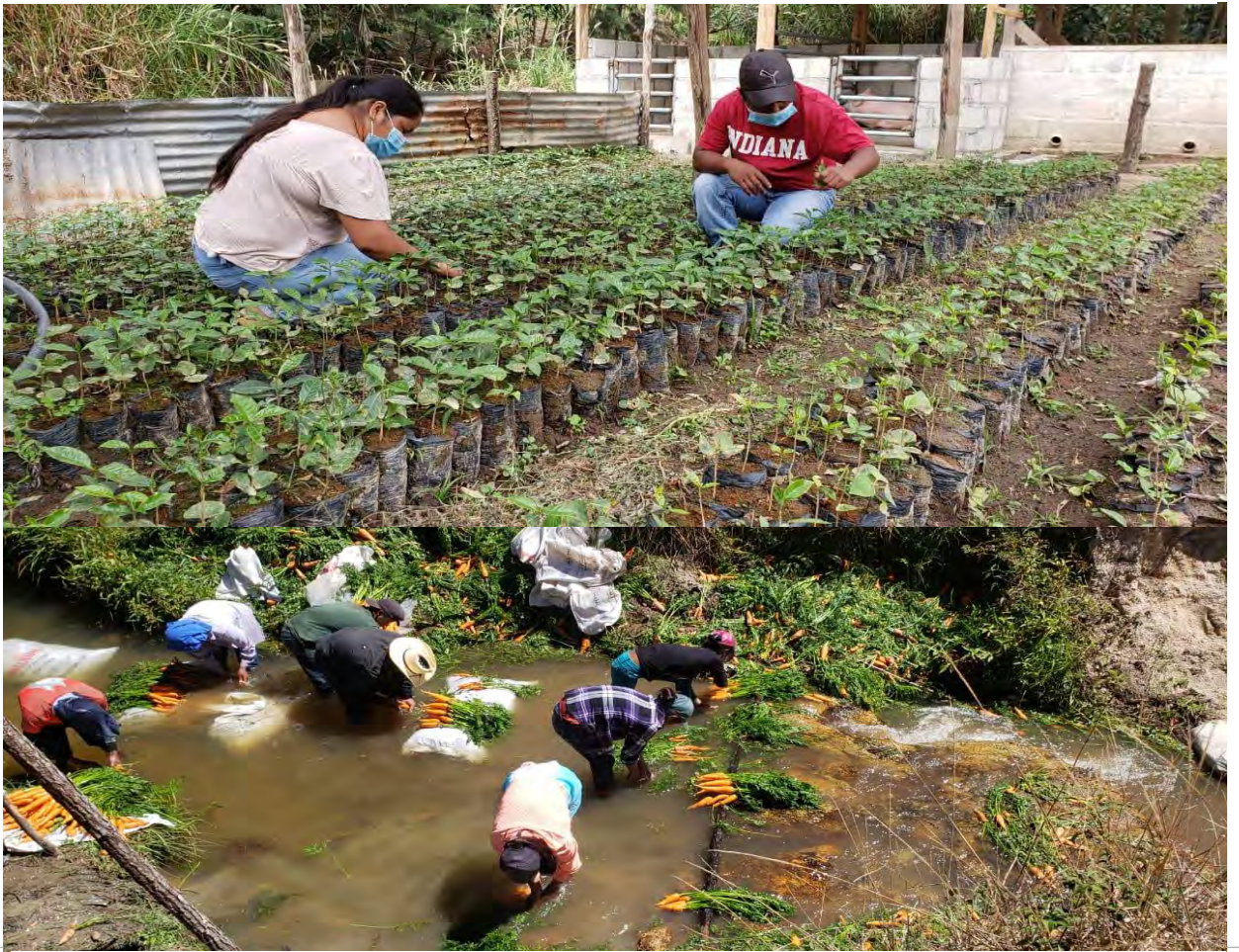
Ilustración 3: Feria agroecológica, La Esperanza Intibucá