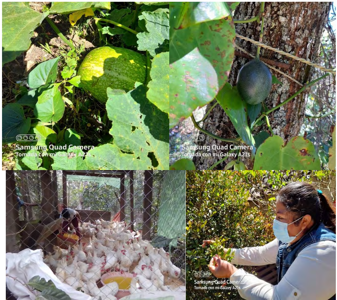
Ilustración 7: Milpas agroecológicas y emprendimiento pollos de engorde, La Esperanza Intibucá (AMIR)