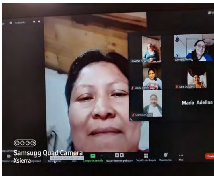
Ilustración 2 Taller ciber activismo digital, grupo de mujeres AMIR

Ha sido evidente la contribución del uso de la tecnología y la contribución del proyecto en la reducción de la brecha digital. Mediante las escuelas se favoreció el acceso y control de la tecnología y herramientas digitales en teléfono, capacitación y promoción del activismo digital, se adopto y adaptó el uso de herramientas digitales en los programas educativos y comunicación con participantes.