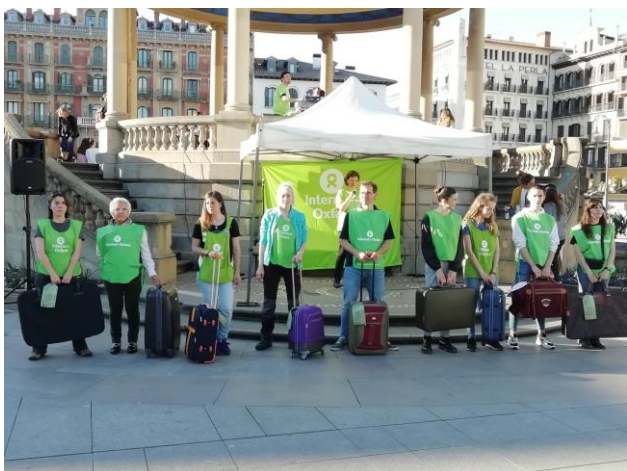
Equipo voluntariado Pamplona

una plataforma de familias empleadoras sensibilizadas que pudiera formar parte de la lucha por la dignificación de este sector.