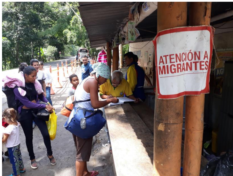
Ruta de protección a migrantes venezolanas en Colombia

La “ruta de protección” para mujeres, niñas y niños se realiza en alianza con la organización colombiana Fundación Mujer y Futuro. Tras ser identificadas las personas de mayor vulnerabilidad nada más cruzar la frontera, normalmente mujeres con niños pequeños a su cargo, reciben información sobre sus derechos, sobre el viaje, sobre riesgos de abuso. También reciben comida, atención de enfermería, productos de higiene y billetes de autobús que les evitan la parte más dramática de la ruta a pie. Entre 60 o 70 personas al día se acogen esta ruta de protección, en total por el momento más de 10.000 mujeres y sus familias que han evitado los abusos y la tremenda dureza de un camino hostil.