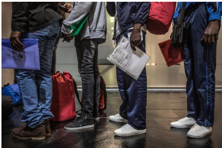
Un grupo de personas migrantes y refugiadas espera su turno para embarcar en un barco que los transporta desde la Ciudad Autónoma de Melilla (enclave español en tierras africanas) frontera con Marruecos hacia Málaga.