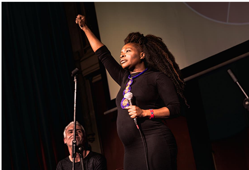
Actuación de Freedomia @FreedomiaSoul, en el acto contra el racismo, por la diversidad y por los derechos civiles WeAreMore. Ateneo de Madrid 28 de marzo de 2019.