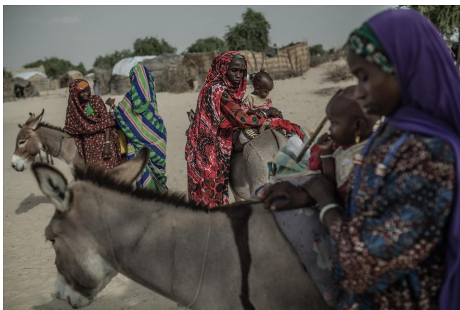
Mujeres desplazadas llegan a la comunidad de Tataverom buscando refugio

diversas crisis: del grupo armado en el Lago, el conflicto de la República Centroafricana en el Sur y la crisis de desnutrición aguda en Yamena. Estas diferentes respuestas han contribuido, por un lado, a salvar la vida de las personas de inmediato y, por otro lado, a desarrollar la resiliencia con un enfoque integrado para la prevención de conflictos a través del acceso a servicios básicos sin tensiones, fortaleciendo sus medios de vida, el empoderamiento progresivo de la población afectada y acciones específicas de consulta y gestión pacífica de conflictos. La estrategia de respuesta humanitaria de Oxfam siempre combina el enfoque de emergencia y recuperación.