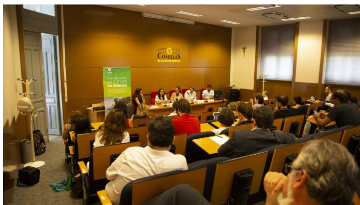
Presentación informe ‘Origen Tránsito y Devolución’

En el mes de julio de 2018 presentamos un documento de discusión titulado ‘ Origen, tránsito y devolución ’ con tres objetivos fundamentales: reubicar los términos del debate migratorio en Europa poniendo las cifras en contexto para evidenciar que estamos, de hecho, ante un fenómeno manejable, analizar las principales tendencias de la política migratoria de la UE en las últimas décadas y sus consecuencias, y resucitar el debate sobre las alternativas al modelo migratorio actual, ofreciendo una batería de posibilidades construida sobre experiencias ya existentes escalables y basándonos en el derecho internacional y los marcos legales europeos y globales. Se presentó con un debate multidisciplinar en el que participaron expertos y expertas de la academia, los medios, y las ONG. Este informe y su contenido aparecieron en los medios hasta en 50 ocasiones, incluyendo prensa escrita , radio y televisión. El resultado más prometedor fue un compromiso de alianza entre los distintos sectores participantes para trabajar conjuntamente en la búsqueda de soluciones a las políticas migratorias actuales.