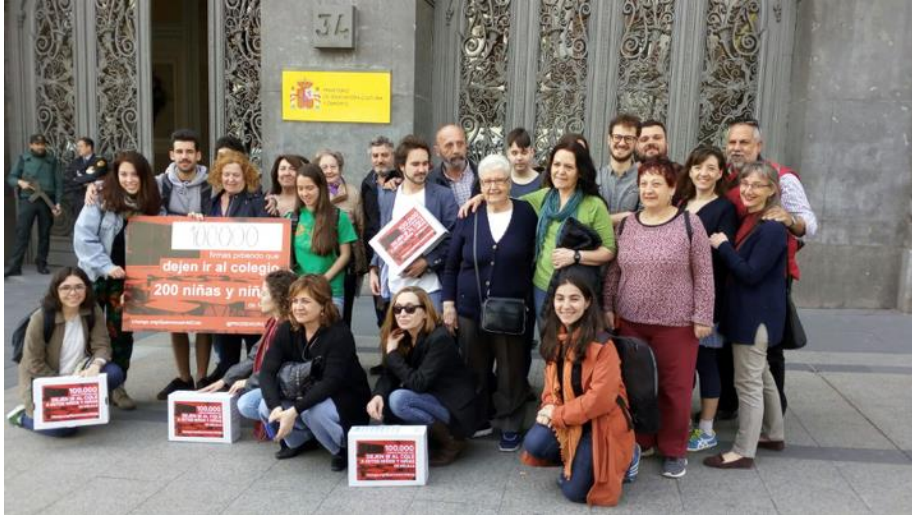
Presentación de las firmas en el Ministerio

Además del éxito de la campaña en términos de apoyo ciudadano, se alcanzó el objetivo de la misma: la escolarización de todos los niños y las niñas durante el curso 2018-2019. En alianza con ProDeIn, y mientras sea necesario, seguiremos velando cada año por el derecho a la educación de los y las menores de Melilla.