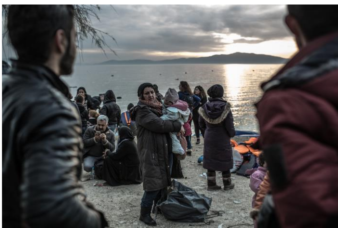
Una mujer de Siria recién llegada a una playa de Lesbos.

En el mes de enero de 2019 publicamos en España el informe para medios “Vulnerables y abandonados” , donde denunciábamos la situación de miles de personas, en particular mujeres y niños, en la isla griega de Lesbos. A finales de diciembre el campo de refugiados de Moria albergaba a casi 5.000 personas, cuando su capacidad no excede las 3.100 plazas. Asimismo, otras 2.000 personas más se encontraban ubicadas en el asentamiento informal Olive Grove, próximo a Moria. Todo como consecuencia de los débiles sistemas de asilo disponibles y de la aplicación de políticas de contención contempladas en el acuerdo UE-Turquía. El informe se centraba en la incapacidad actual del sistema para identificar y proteger adecuadamente a las personas más vulnerables, así como para garantizar la seguridad y los servicios sociales más básicos dentro de los campos. Especialmente preocupante era la ausencia de médicos: tras la renuncia del último médico asignado por el Gobierno en la isla griega de Lesbos, en noviembre de 2018, las evaluaciones de vulnerabilidad no se habían llevado a cabo.