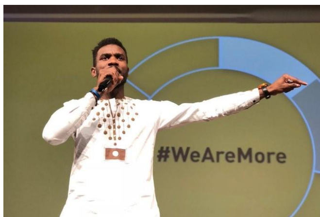
Momento del acto contra el racismo, por la diversidad y por los derechos civiles WeAreMore en el Ateneo de Madrid.

900 personas asistieron a los eventos 'We Are More' en Madrid y Barcelona (350 y 550 respectivamente), con alto impacto mediático y el liderazgo de 10 sujetas racializadas que hicieron de portavoces en los eventos.