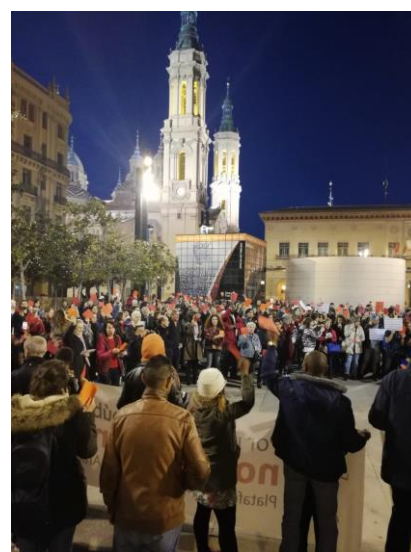
Manifestación en Zaragoza con motivo del día internacional contra el racismo y la xenofobia (21 de marzo)

España recibió en 2018 el 53% de las llegadas de migrantes consideradas irregulares por mar y tierra a Europa (unas 65.000 personas, o el equivalente al 0,12% de su población). Aunque este número es marginal en el conjunto de los movimientos migratorios, está sobredimensionado en el debate público y el discurso político. De nuevo, las políticas migratorias se han marcado como objetivo frenar a toda costa en vez de gobernar los movimientos de personas. Los elementos lesivos de la valla de Melilla, las trabas a las organizaciones de rescate en el Mediterráneo, contribuyendo a su criminalización, las