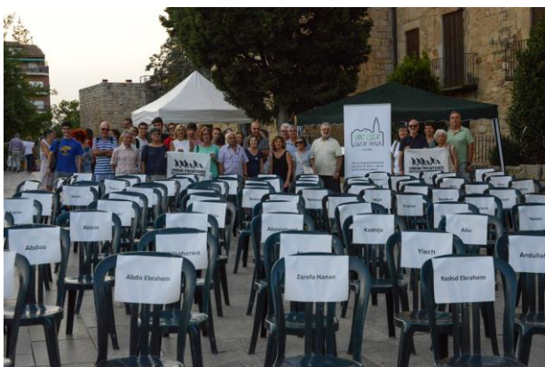
Equipo de voluntariado Sant Cugat

Los equipos de voluntariado de Oxfam en las distintas ciudades españolas han realizado hasta 74 actividades presenciales durante 2018-2019 en torno a los derechos de las personas migrantes y