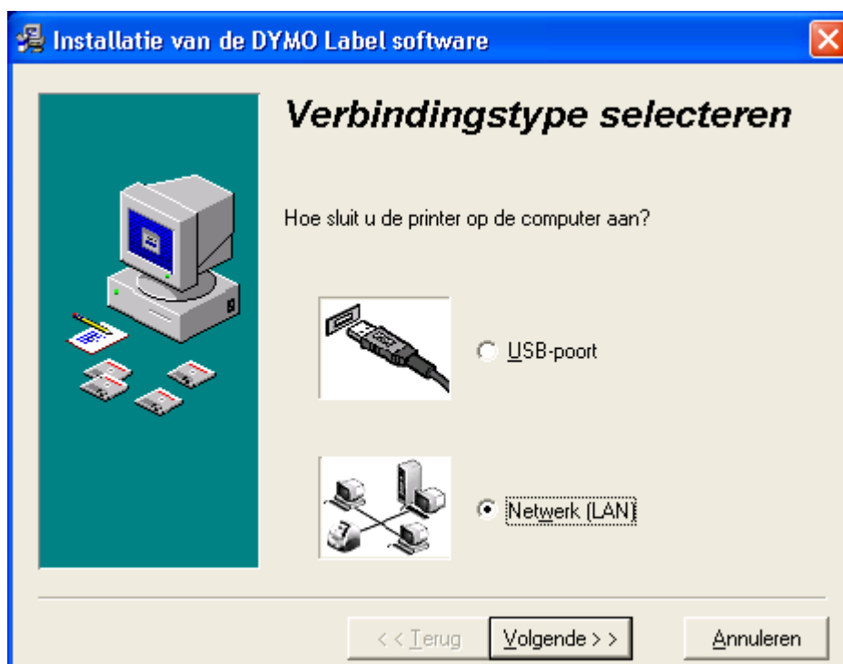
Afbeelding 1: Kies bij verbindingstype voor 'Netwerk (LAN)'