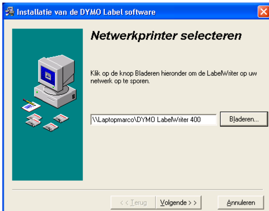
Afbeelding 3: Selecteer d.m.v. 'Bladeren' de netwerklocatie van de LabelWriter