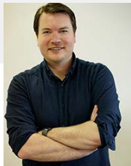
Online Marketing Strategie