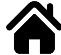
A LA VIVIENDA