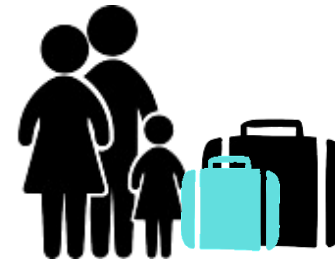
A LOS HUÉSPEDES