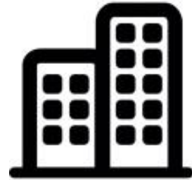
A LA COMUNIDAD