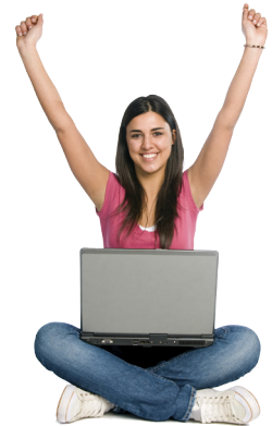
Éxito del Estudiante