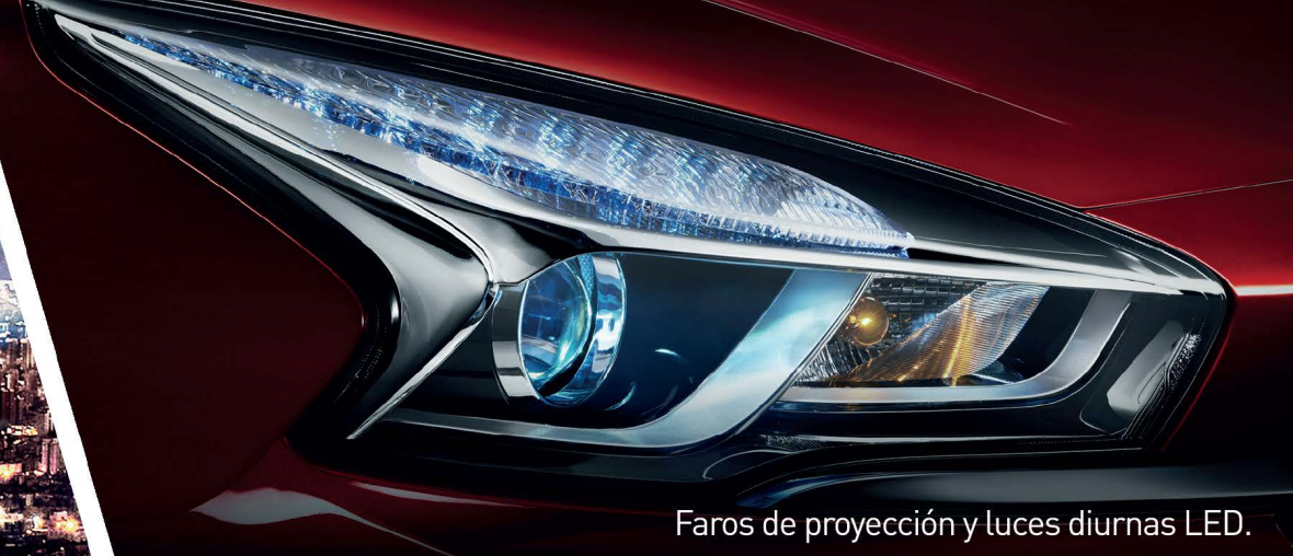
Faros de proyección y luces diurnas LED.