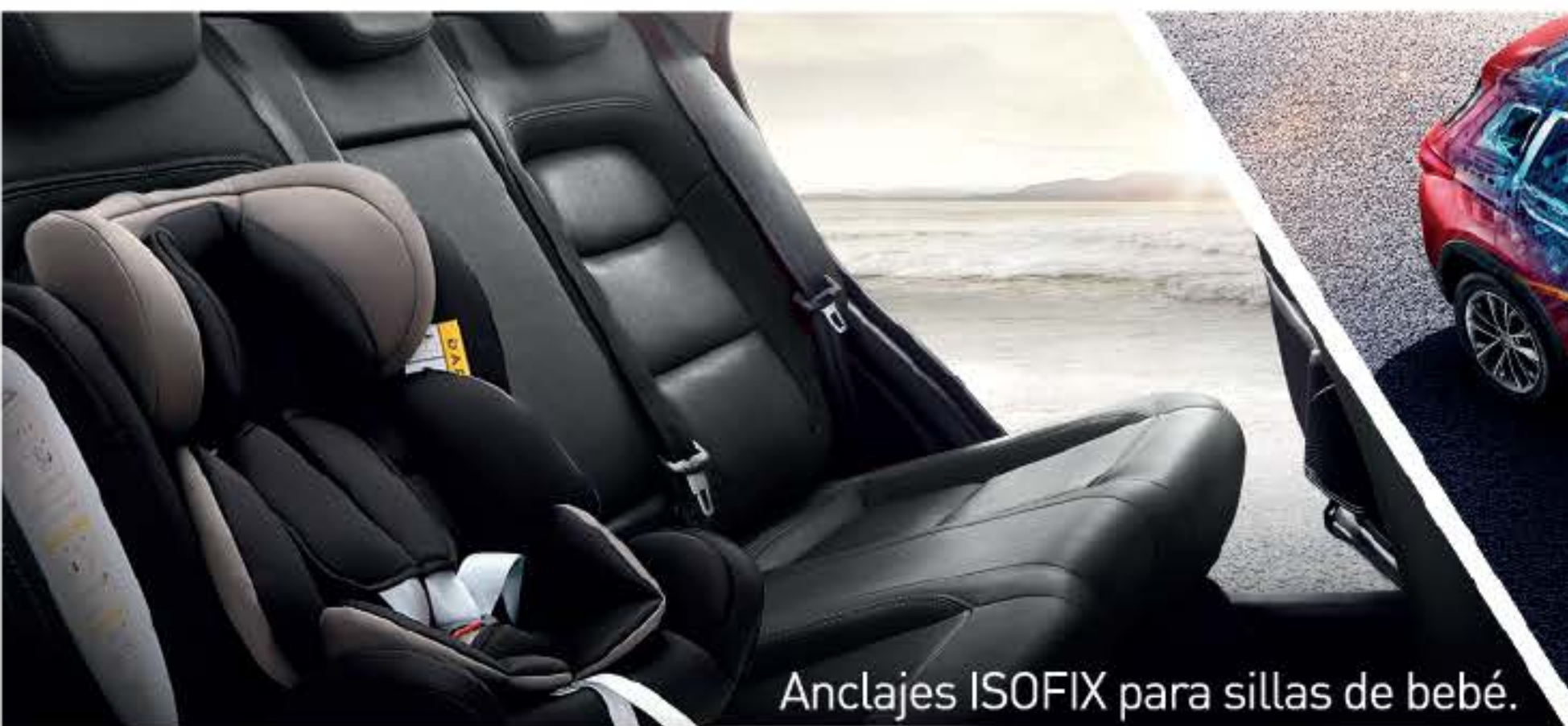
Anclajes ISOFIX para sillas de bebé.