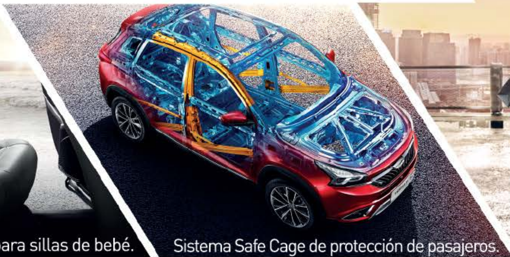
Sistema Safe Cage de protección de pasajeros.