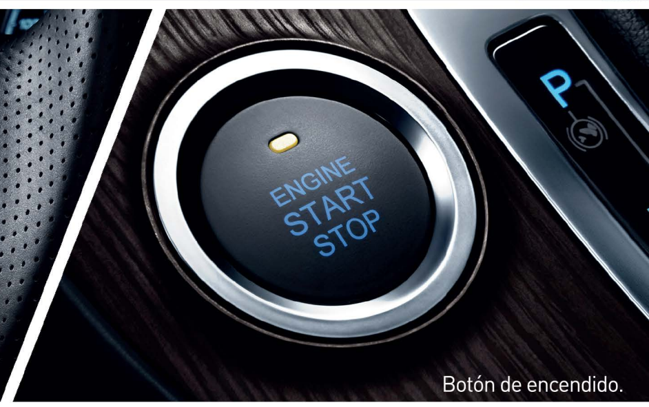
Botón de encendido.