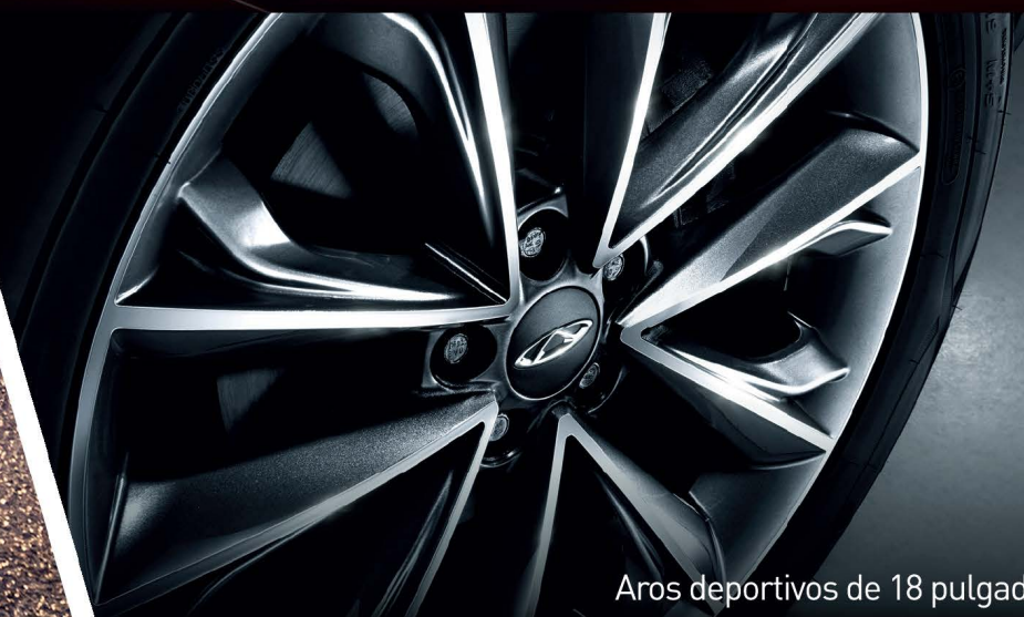
Aros deportivos de 18 pulgadas.