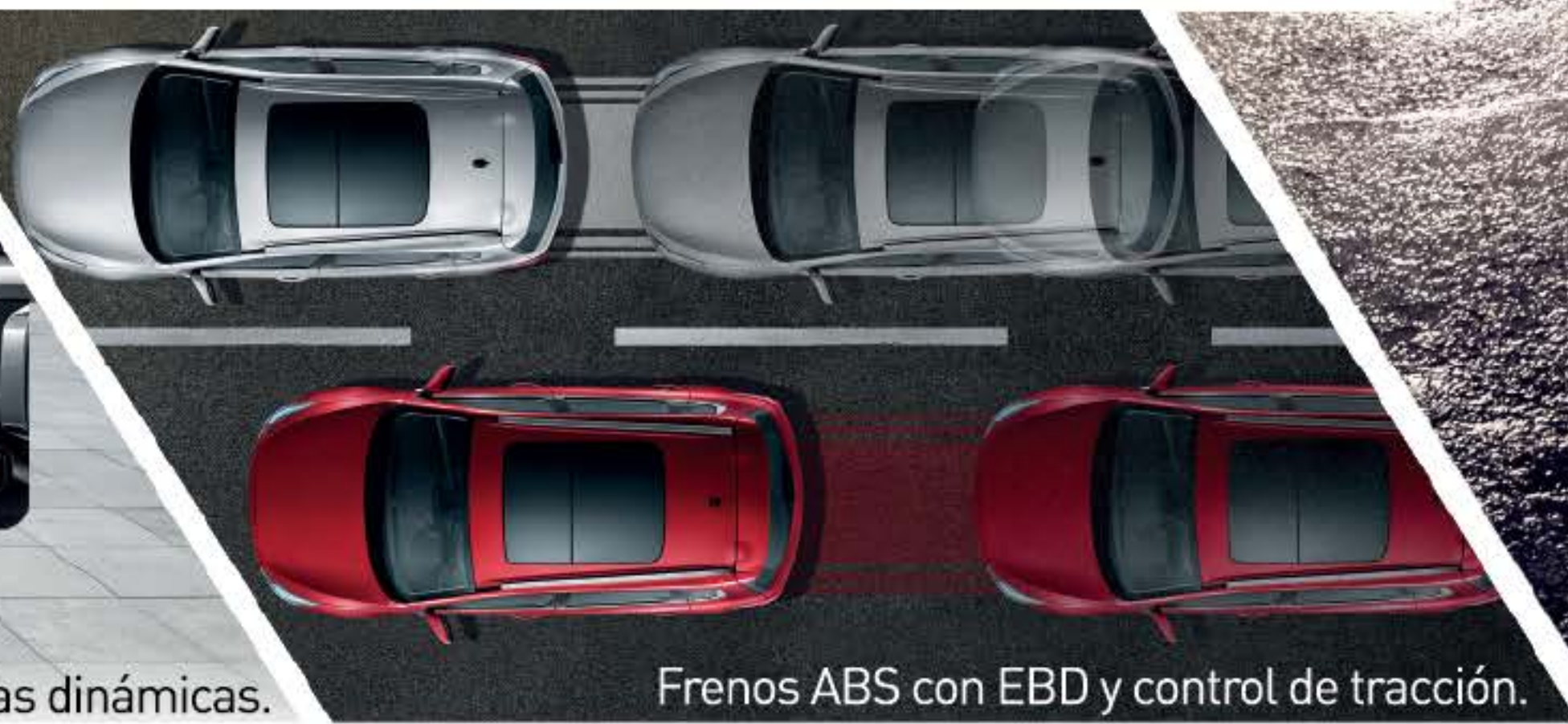
Frenos ABS con EBD y control de tracción.