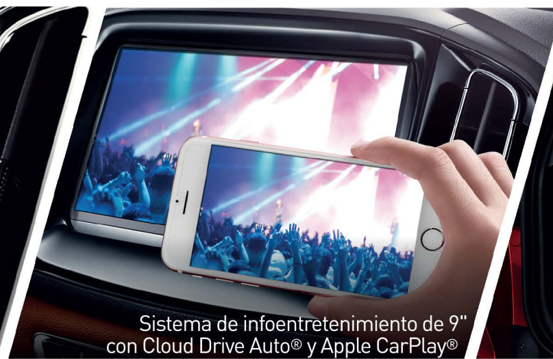
Sistema de infoentretenimiento de 9" con Cloud Drive Auto® y Apple CarPlay®