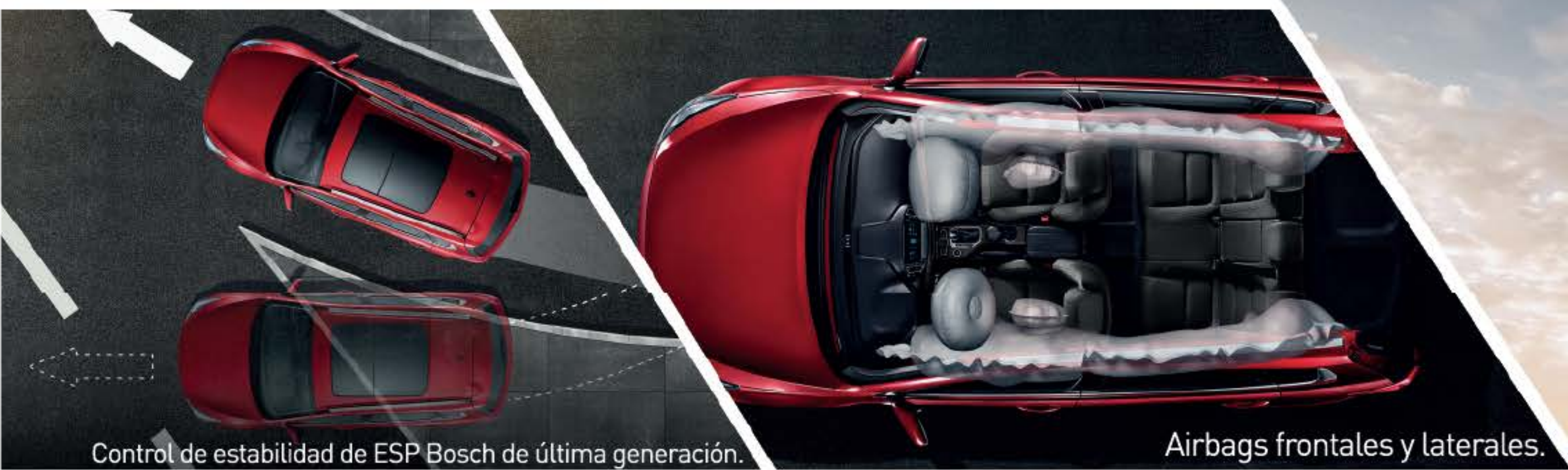
Control de estabilidad de ESP Bosch de última generación.