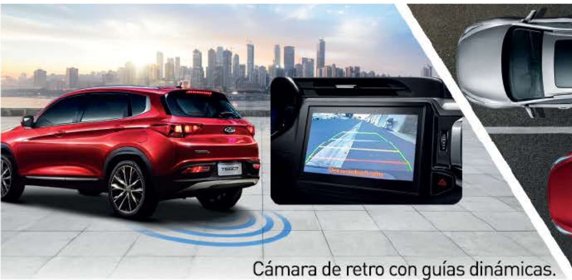
Cámara de retro con guías dinámicas.