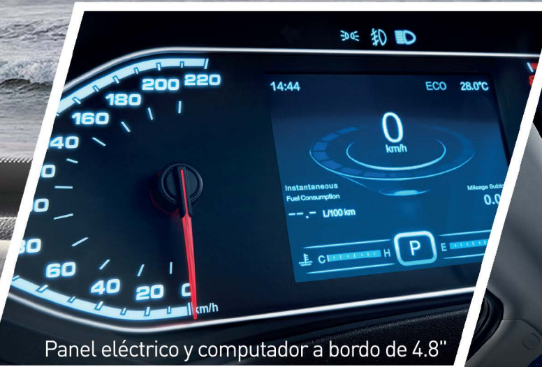
Panel eléctrico y computador a bordo de 4.8"