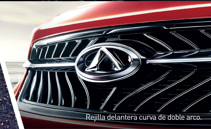
Rejilla delantera curva de doble arco.