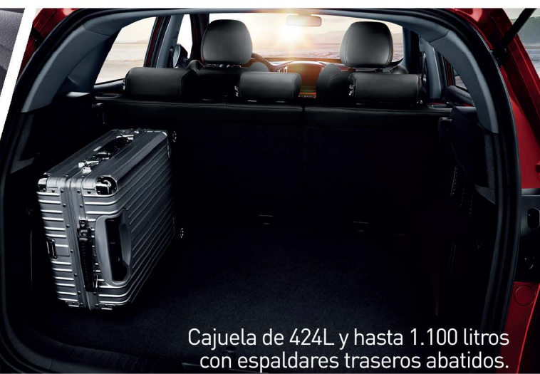
Cajuela de 424L y hasta 1.100 litros con espaldares traseros abatidos.