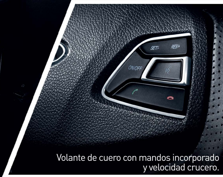
Volante de cuero con mandos incorporado y velocidad crucero.