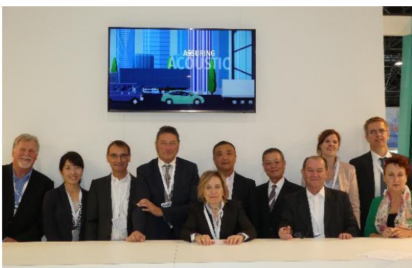
Das EVERLAM-Team auf der Glasstec.