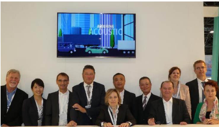
El equipo EVERLAM en Glasstec.