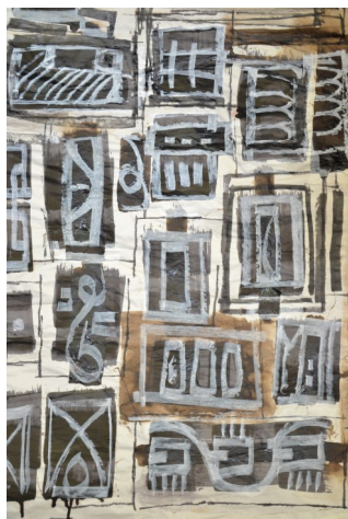
Opera realizzata alla Bottega dell'Arte dell'IRCCS