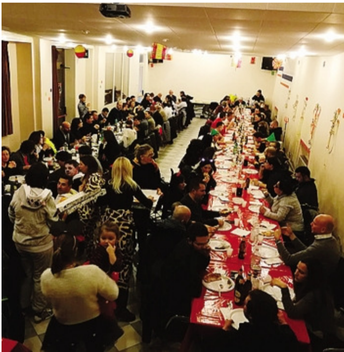
Il salone dell'oratorio rimesso a nuovo grazie a quanto lasciato dal marito della catechista scomparsa a gennaio

Prima di ammalarsi gravemente aveva avviato un'attività