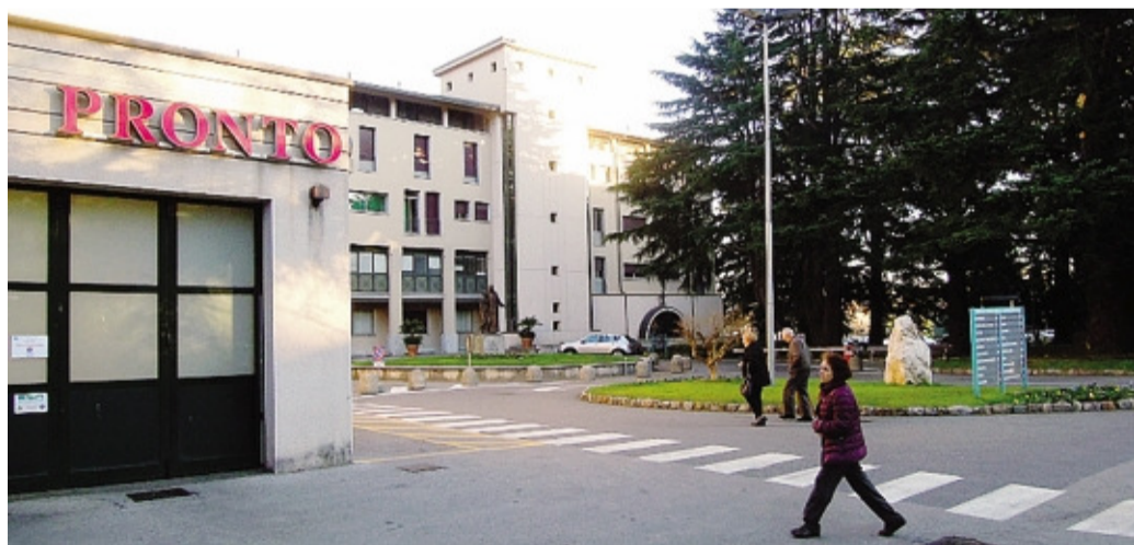
L'ingresso al pronto soccorso dell'ospedale di Erba

La fase finale del concorso si è conclusa lo scorso 27 febbraio, quando la commissione esaminatrice ha incontrato faccia a faccia tre pretendenti: tutti e tre sono stati ritenuti idonei, anche