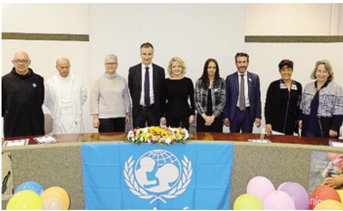
Dirigenti, amministratori pubblici e delegati Unicef presenti