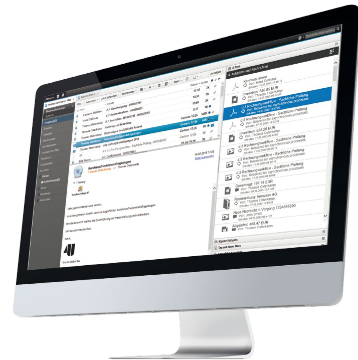
d.3one integriert in Ihrem IBM Notes Client. Greifen Sie einfach auf Ihre Aufgaben und Nachrichten zu – direkt aus Ihrem E-Mail-Client