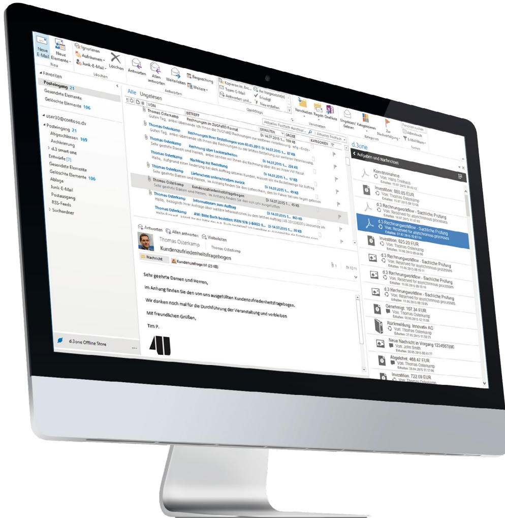
d.3one integriert in Ihrem Microsoft Outlook Client. Greifen Sie einfach auf Ihre Aufgaben und Nachrichten zu – direkt aus Ihrem E-Mail-Client.