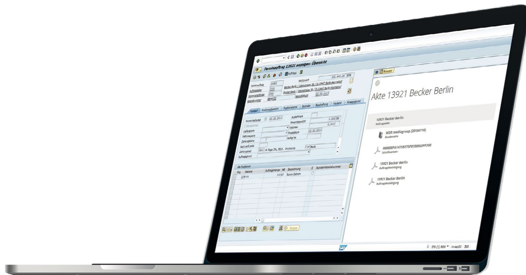
d.3one integration for SAP® ERP.

ERP-Anwendungssysteme wie SAP, Microsoft Dynamics Nav, etc. sind für viele Anwender die am meist genutzte Software, um die täglichen Aufgaben zu erledigen. d.3one kann nahtlos in Ihr ERP-System eingebunden werden, um die Prozesse darin zu optimieren.