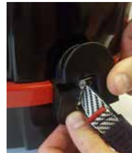
Schritt 2: Zusammengefügte Hälften des Öffnungsstücks entfernen