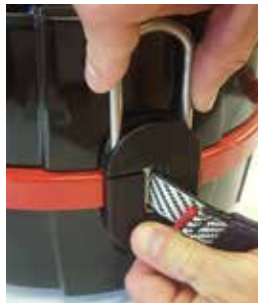
Schritt 1: Splint entfernen