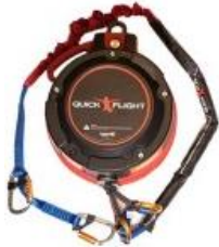
Model QF150-12A (Low mount and Standard 12.5m) with 1m, 2m ripcord