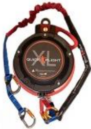
Model QFXL150-20A (20m) with 1m, 2m ripcord