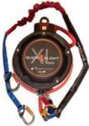
Model QFXL150-20A (20m) with 1m, 2m ripcord