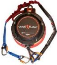
Model QF150-12A (Low mount and Standard 12.5m) with 1m, 2m ripcord