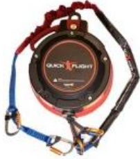
Model QF150-12A (Low mount and Standard 12.5m) with 1m, 2m ripcord