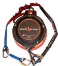
Model QF150-12A (Low mount and Standard 12.5m) with 1m, 2m ripcord