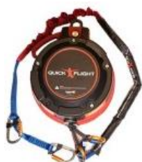
Model QF150-12A (Low mount and Standard 12.5m) with 1m, 2m ripcord