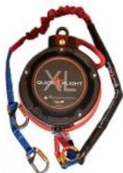
Model QFXL150-20A (20m) with 1m, 2m ripcord