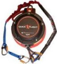
Model QF150-12A (Low mount and Standard 12.5m) with 1m, 2m ripcord