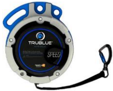
Model TBSD150-20 (16m and 12.5m)