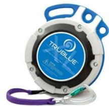
Model TBXL150-20A (20m)