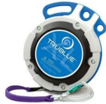
Model TBXL150-20A (20m)