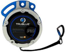
Model TBSD150-20 (16m and 12.5m)