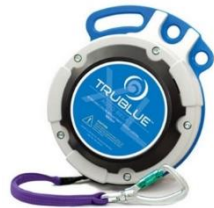
Model TBXL150-20A (20m)