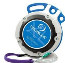
Model TBXL150-20A (20m)