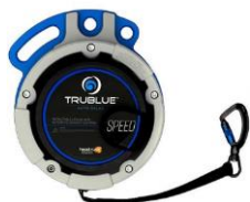
Model TBSD150-20 (16m and 12.5m)