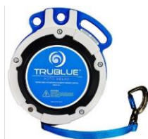
Model TB150-12C (12.5m and 7.5m)