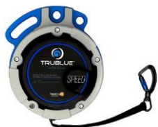
Model TBSD150-20 (16m and 12.5m)