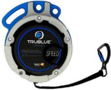
Model TBSD150-20 (16m and 12.5m)