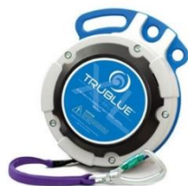
Model TBXL150-20A (20m)