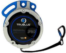
Model TBSD150-20 (16m and 12.5m)