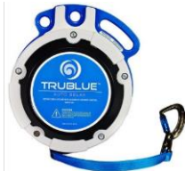
Model TB150-12C (12.5m and 7.5m)