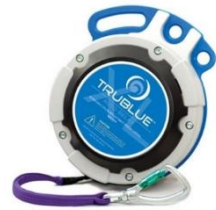
Model TBXL150-20A (20m)