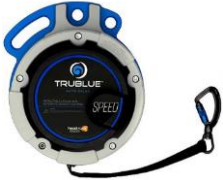
Model TBSD150-20 (16m and 12.5m)