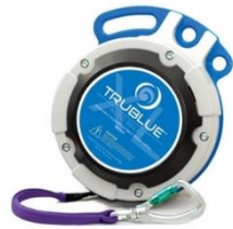
Model TBXL150-20A (20m)