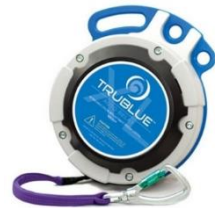
Model TBXL150-20A (20m)