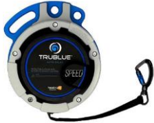
Model TBSD150-20 (16m and 12.5m)