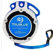
Model TB150-12C (12.5m and 7.5m)