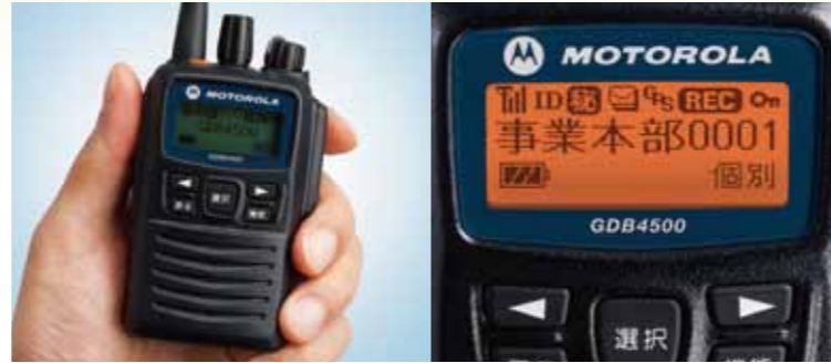
ディスプレイ: 実物大(バックライト点灯時)

残したい用件をすばやく録音できる便利な音声メモ機能は、後で繰り返し内容を確認することができます。直近の受信音声は常に保存され、応答できない場合でもリピート再生が可能です。