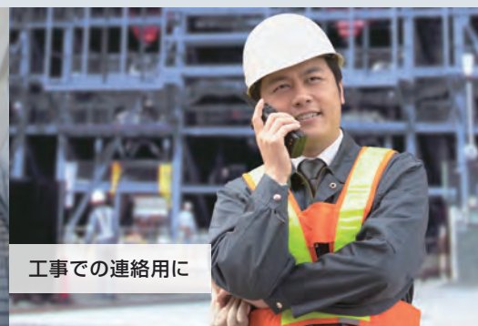
工事での連絡用に