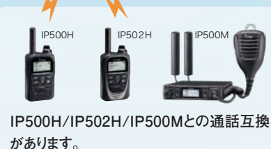
IP500H/IP502H/IP500Mとの通話互換 があります。