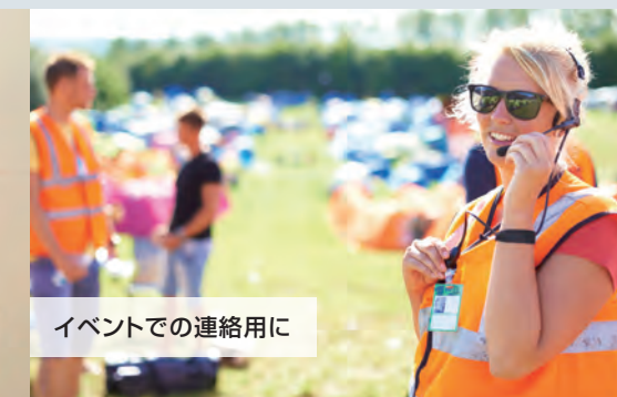
イベントでの連絡用に