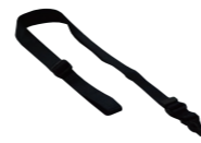
ネック ストラップ SK-T03