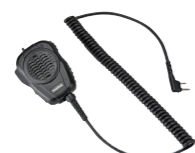
大音量防水スピーカーマイク MP68 (IP67*相当 防水・防塵性能、 スピーカー出力2W 3.5φイヤホン端子付き)