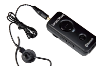
Bluetooth® イヤホンマイク SK-M03