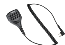
大音量スピーカーマイク MP16 (IP54*相当 防水・防塵性能、 スピーカー出力2W 3.5φイヤホン端子付き)