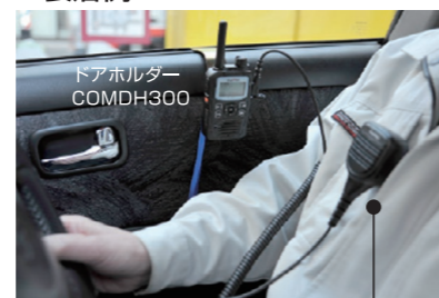
大音量スピーカーマイク MP16