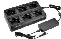
6連急速充電器 (ACアダプタ付) SK-P04