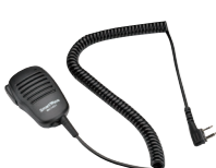
スピーカーマイク SK-M01 (スピーカー出力 0.5W 3.5φイヤホン端子付き)

※運転中のイヤホン、ヘッドホンの装着は各都道府県の条例で規制されている場合があります。