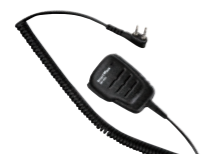
防水スピーカーマイク SK-M04 (IP67*相当防水・防塵性能 スピーカー出力 0.5W)