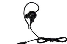
スピーカーマイク用 イヤホン SK-E01 (ケーブル長 約0.5m)