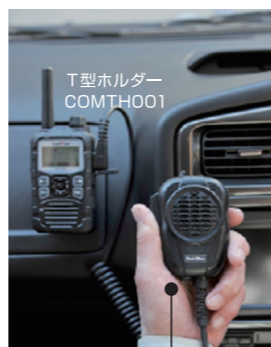
大音量防水スピーカーマイク MP68