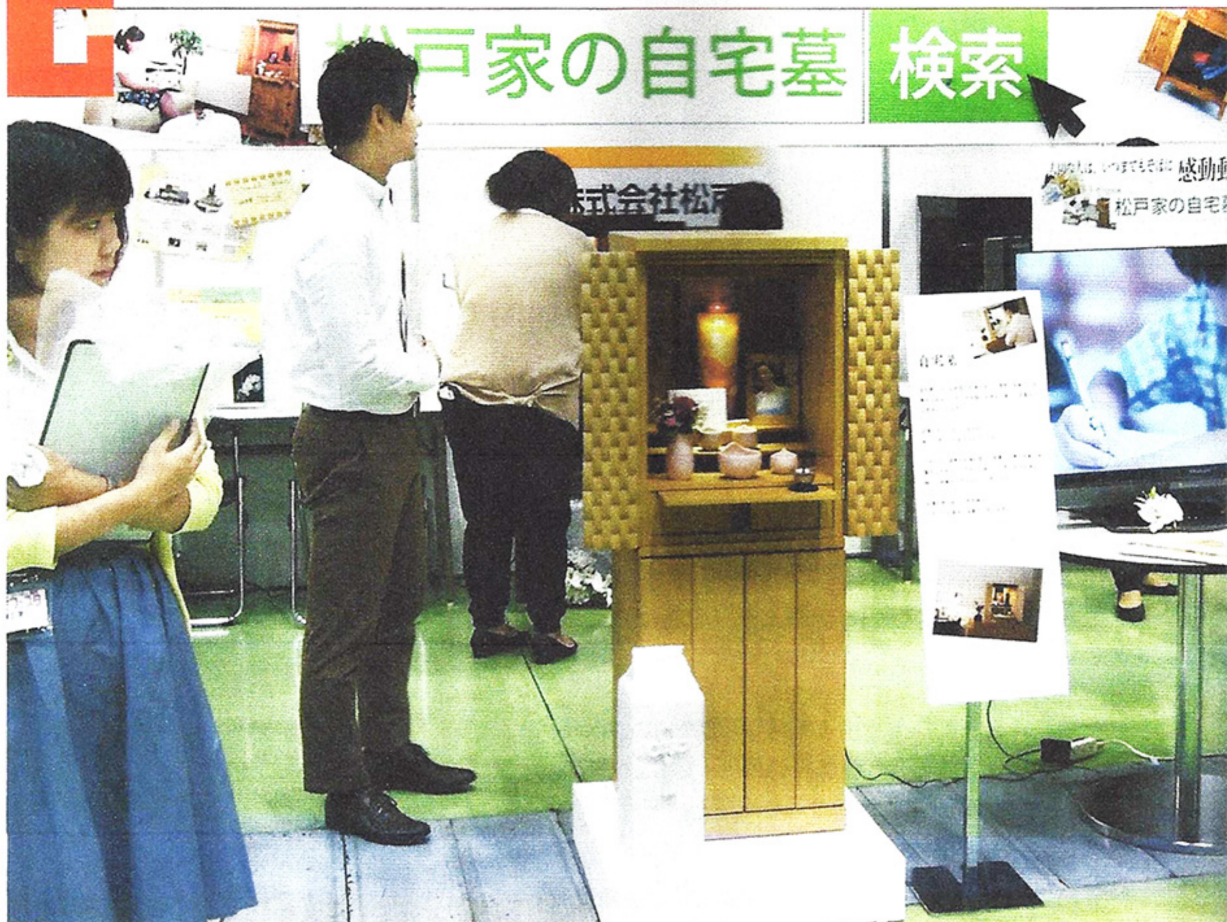
∞ 近年東京舉辦多場葬禮儀展覽，有公司甚至推動葬禮團購供15~50人集體購買，更找來國外業者參展，成為日本最大的終活產業展。